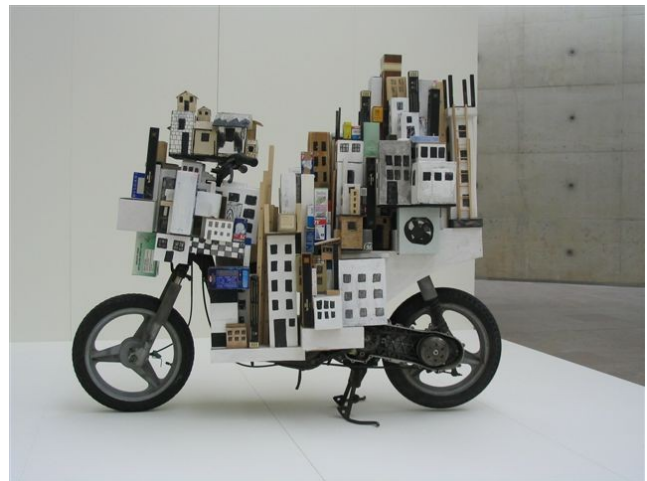
Philip Rantzer Het grote vehikel . Gemengde techniek.

De kunstenaars, zowel Israëli's als Palestijns, sommigen opgegroeid in andere landen, nu wonend in grote steden of kleine dorpen, zij allen tonen, hier in Scheveningen, wat er in hen omgaat.