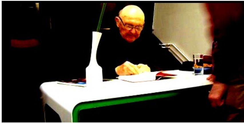
Aharon Appelfeld signeert zijn boek.